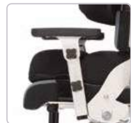
Regulacja wysokości i kąta nachylenia podłokietnika