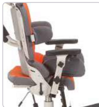
Ustawienia pelotów udowych w zależności od potrzeb pacjenta