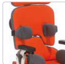
Regulacja wysokości wraz z pelotami piersiowymi