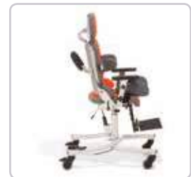
Ustawienia kąta nachylenia MADITY