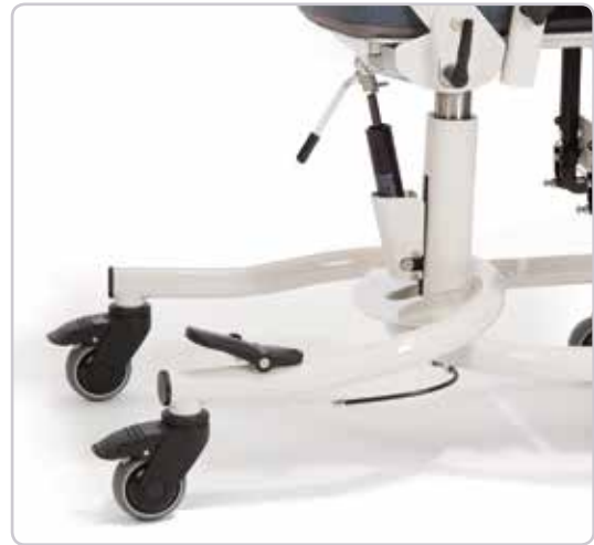
Pochylenie siedziska jest wykonywane z pomocą sprężyny gazowej a regulacja wysokości za pomocą pedału

■ Podczas czasu relaksu krzesło terapeutyczne MADITA może być ustawione w pozycji poziomej.