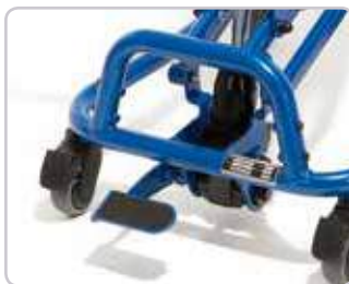
MADITA-Fun może być wyposażona w hydrauliczną regulację wysokości