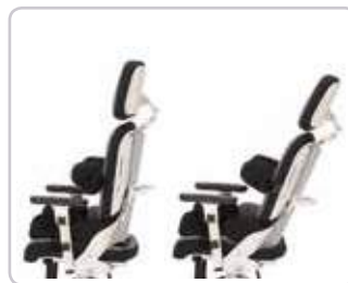
Kąt nachylenia oparcia od (-) 5° - 25°