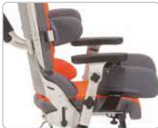
Regulacja głębokości siedzenia