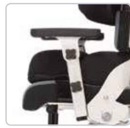
Regulacja kąta nachylenia oraz wysokości podłokietnika