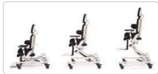
Możliwość regulacji wysokości siedziska pozwala na dopasowanie MADITY-Fun do każdego otoczenia