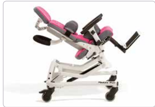
Seat angle can be adjusted up to 37°

■ Krzesło terapeutyczne MADITA-FUN stanowi idealną podstawę do budowy indywidualnych potrzeb każdego pacjenta