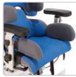
Szerokość siedziska jest regulowana poprzez peloty udowe